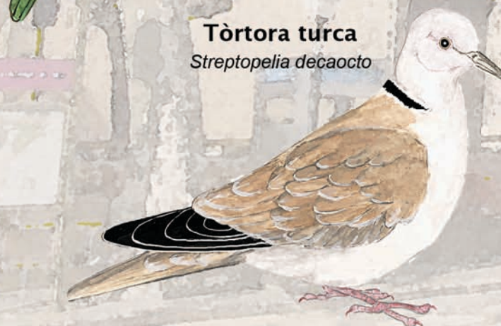
Tòrtora turca Streptopelia decaocto