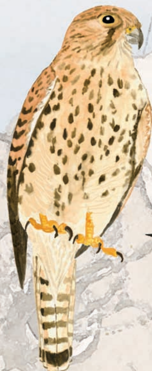
Xoriguer ♀ Falco tinnunculus