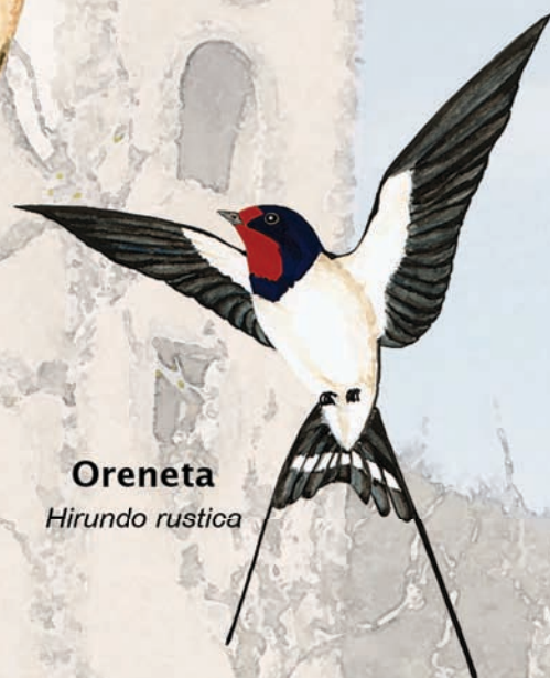
Oreneta Hirundo rustica