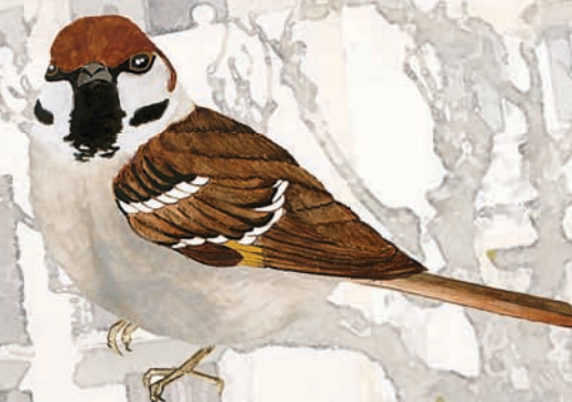
Pardal xarrec Passer montanus