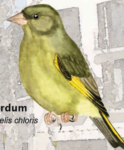
Verdum Carduelis chloris