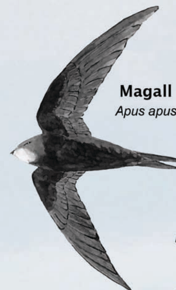
Magall Apus apus