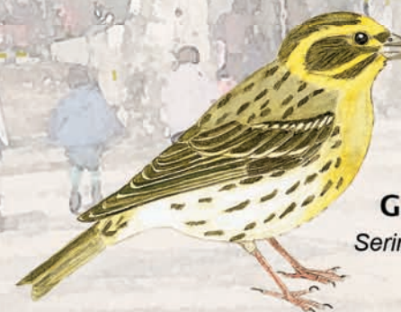
Gafarró Serinus serinus