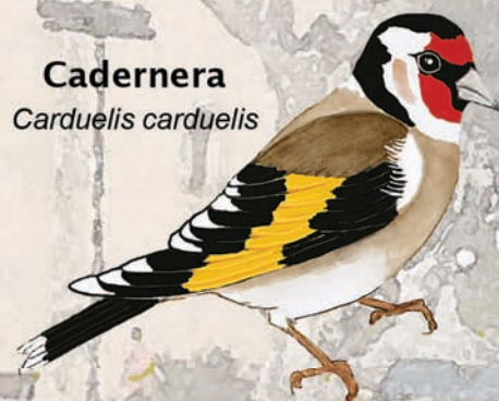
Cadenera Carduelis carduelis