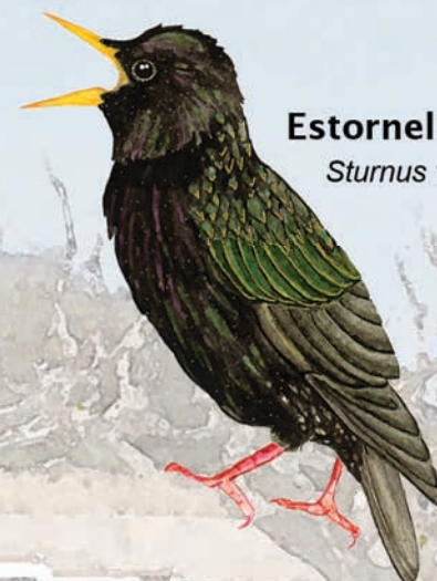
Estornell vulgar Sturnus vulgaris