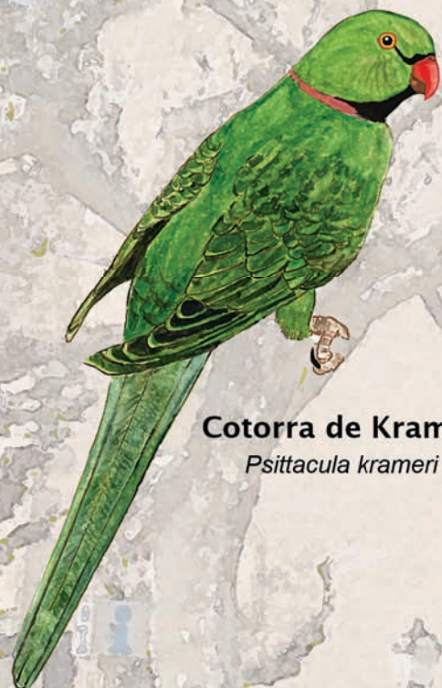
Cotorra de Kramer ♂ Psittacula krameri