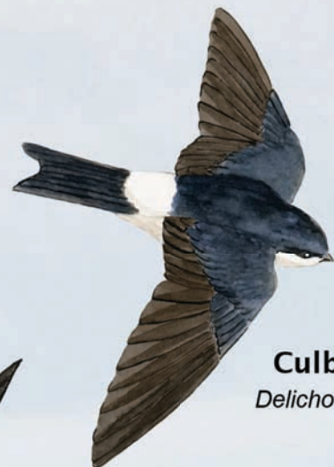
Culblanc Delichon urbica