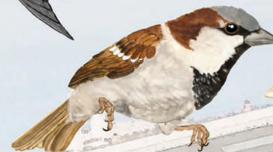
Pardal ♂ Passer domesticus