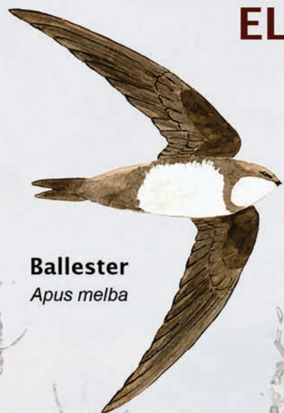
Ballester Apus melba