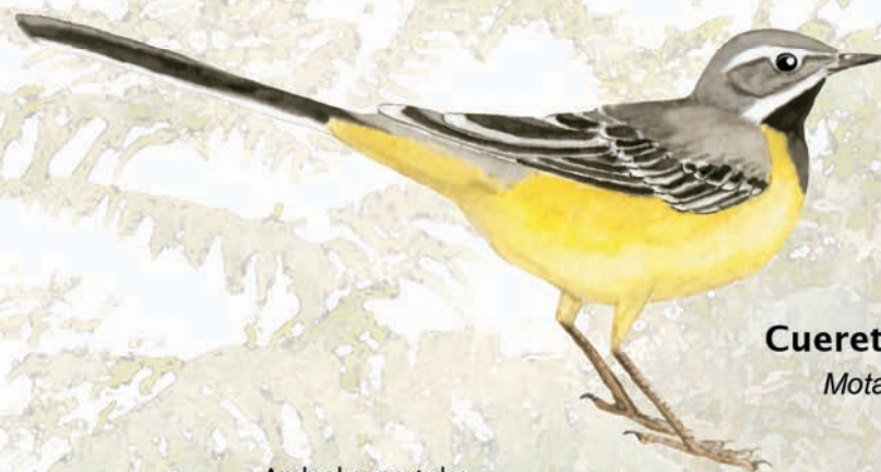
Cuereta torrentera Motacilla cinerea