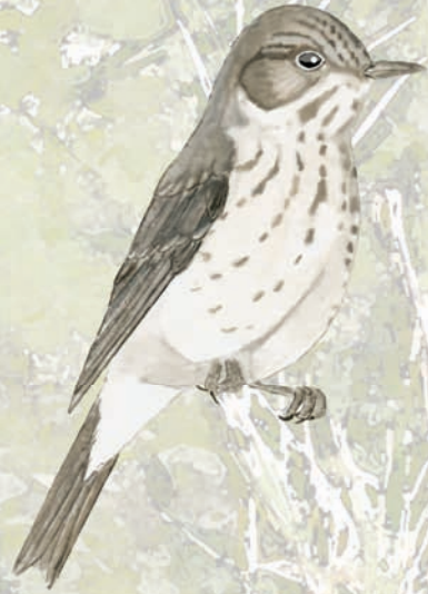
Papamosques gris Muscicapa striata