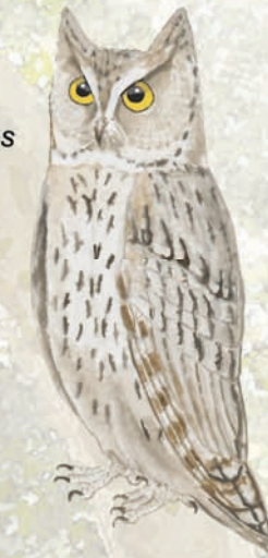
Xot Otus scops