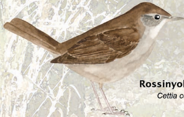
Rossinyol bord Cettia cetti