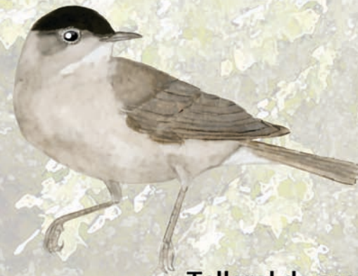
Tallarol de casquet Sylvia atricapilla