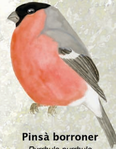
Pinsà borroner Pyrrhula pyrrhula