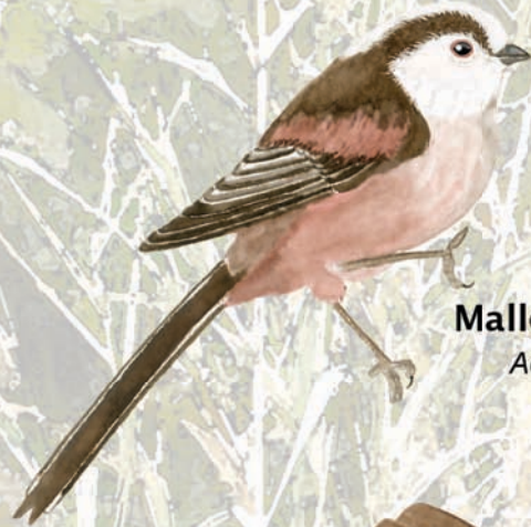
Mallerenga cuallarga Aegithalos caudatus