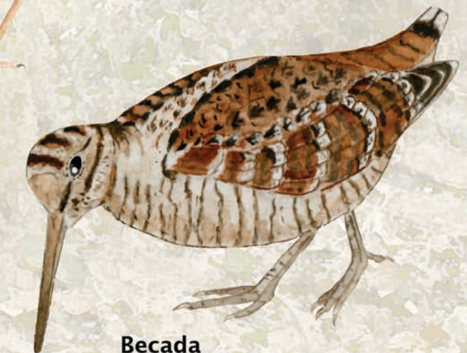
Becada Scolopax rusticola