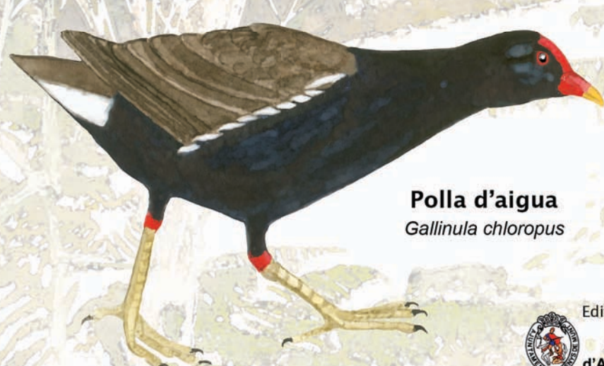
Polla d'aigua Gallinula chloropus