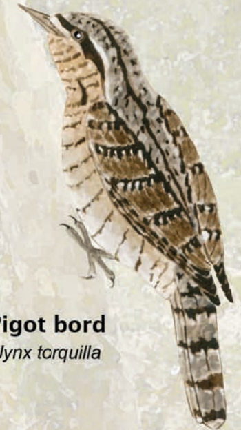
Pigot bord Jynx torquilla