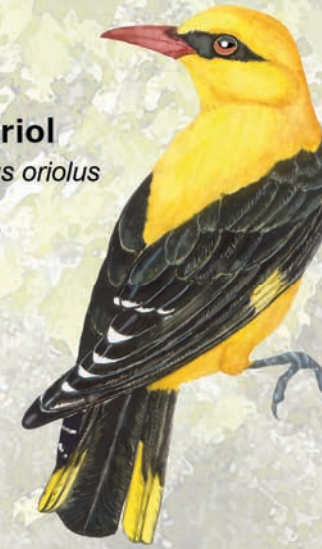
Oriol Oriolus oriolus