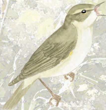
Mosquiter comú Phylloscopus collybita