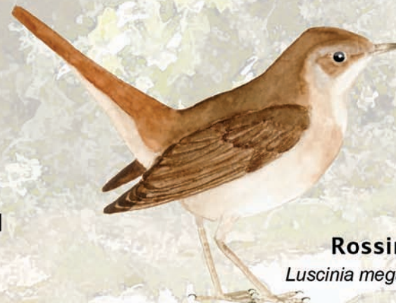
Rossinyol Luscinia megarhynchos