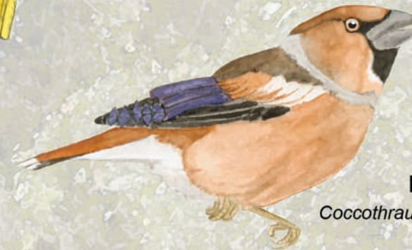
Durbec Coccothraustes coccothraustes